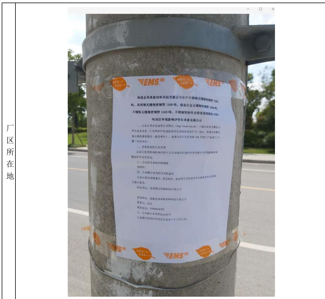
图 3.2-6 现场公告照片

根据《环境影响评价公众参与办法》第十一条中“通过在建设项目所在地公众易于知悉的场所张贴公告的方式公开,且持续公开期限不得少于10个工作日”的要求,在本项目网络公示期间,我公司于2020年8月18日在项目厂区周边道路张贴了本项目环境影响评价征求意见稿公示材料。